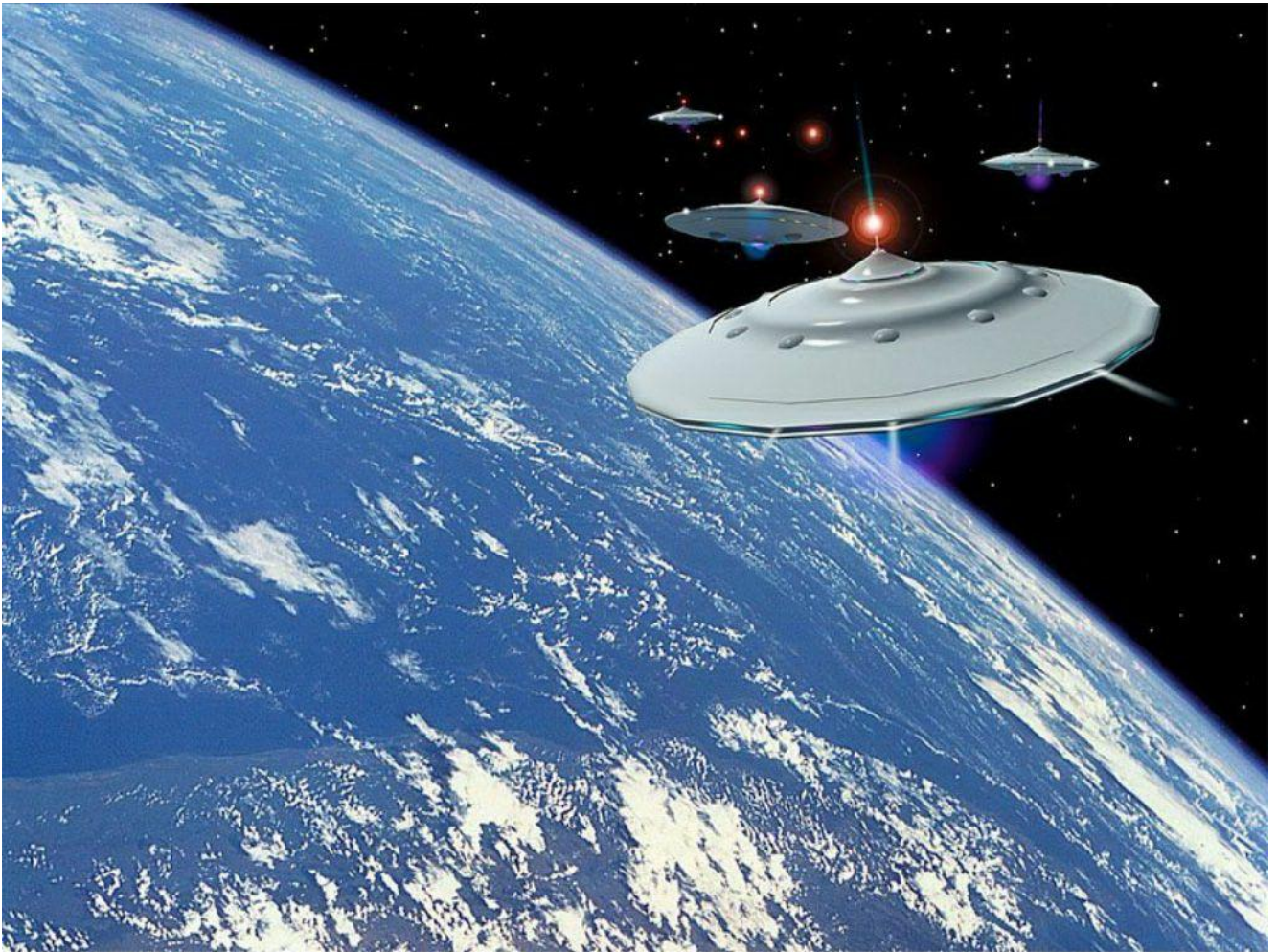
Lodě civilizace Sil světla Methária, světlo nad kokpitem je komunikační vysílač a přijímač s mateřskou lodí, která je zobrazena na obr. 127 v knize "II. Rozhovory...". Fotomontáž.